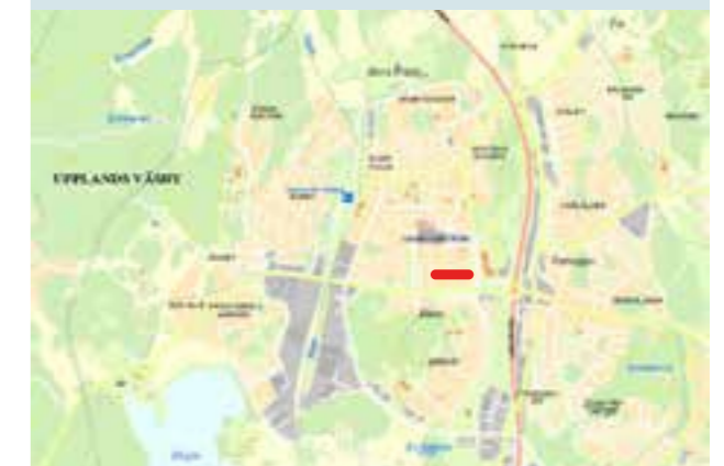
Planområdets ungefärliga läge är markerat i rött.

Ange diarienummer KS/2020:512 i skrivelsen