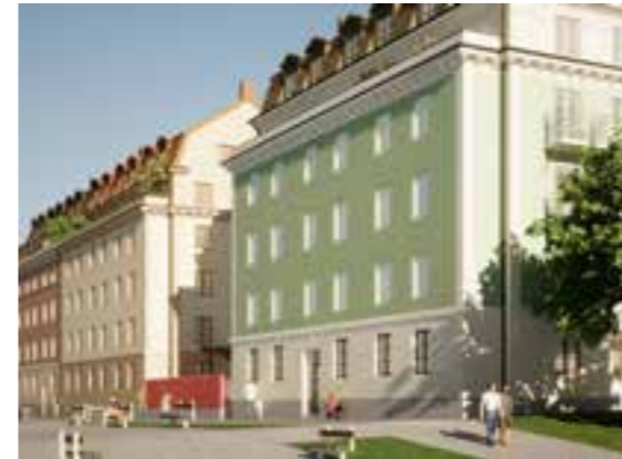
Bild över kvarter 1 sett från den planerade gatan norr om bebyggelsen.