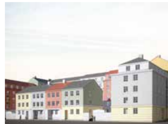
Bild över kvarter 2 sett från den planerade gatan norr om bebyggelsen.