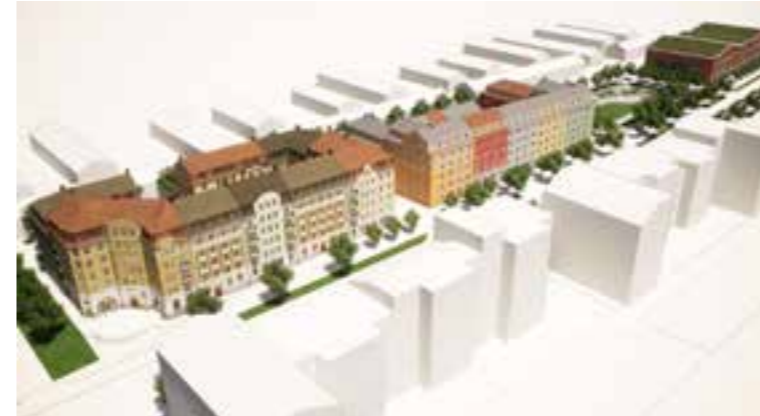
Perspektivbild över hela planområdet.